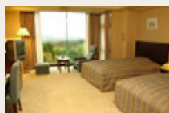
お部屋タイプは 洋室ツインルーム (40 平米)