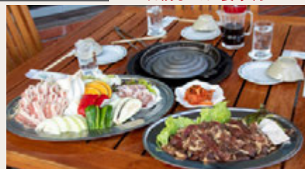
▲ジンギスカンコース

※料理写真はイメージです。 ※食材の仕入れ状況により、料理内容が変更になる場合がございます。予めご了承ください。