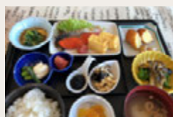
ご朝食は和食 or 洋食のセット メニュー (日替わり) ※バイキングの場合も有り