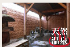
爽やかな風を感じる露天風呂